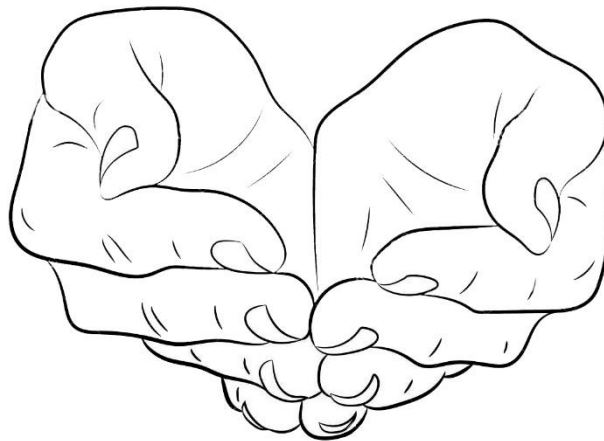
Imagen ANEXO 1

El gesto que acompañará a los Guiones Litúrgicos, para potenciar la sensibilización de la comunidad en nuestras parroquias durante la campaña « Tiende tu mano y enrédate » serán unas manos (ver imagen – ANEXO 1 – Manos), que representarán las manos del Padre. Debajo de estas, situaremos una red (tipo red de pesca o de portería de fútbol) y cada mes iremos colocando una mano (ver imagen – ANEXO 2 – Mano para Temas), en la que llevará escrito la temática correspondiente al mes. De esta manera mostraremos nuestro compromiso, « enredándonos » y dejándonos sensibilizar por dicho tema.