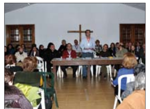
Clausura del Cursillo de Cristiandad nº245.

El sábado 3 y el domingo 4 de marzo se celebrará el encuentro anual de jóvenes.