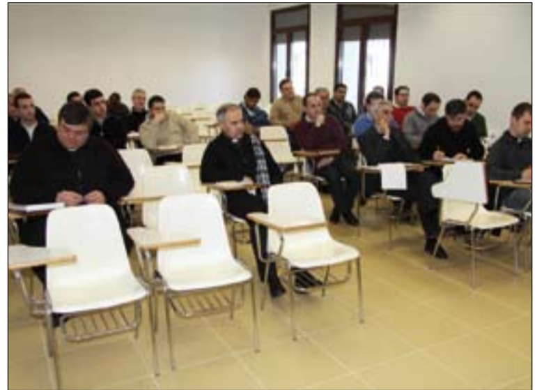
Seminaristas mayores y rectores de Extremadura, durante las ponencias.

Si hubiera que resumir algunos de los contenidos podrían ser éstos: La formación litúrgica es uno de los grandes medios para renovación cristiana exigida por el Vaticano II y abarca diversos aspectos: