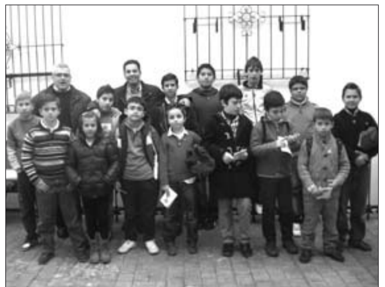
Niños que participaron en la convivencia vocacional.

Todos los niños se marcharon con el deseo y la ilusión de tomar parte en el Encuentro Diocesano de Monaguillos y en las distintas actividades que viene organizando la Delegación Diocesana de Pastoral Vocacional.