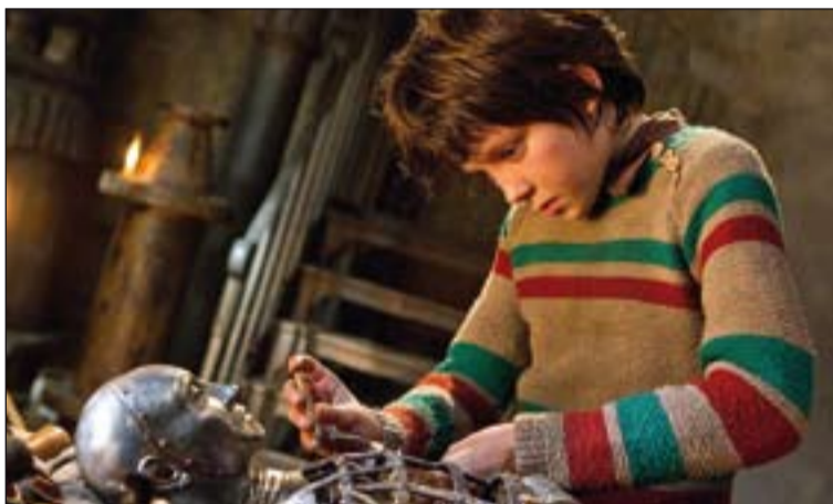
Fotograma de La invención de Hugo .